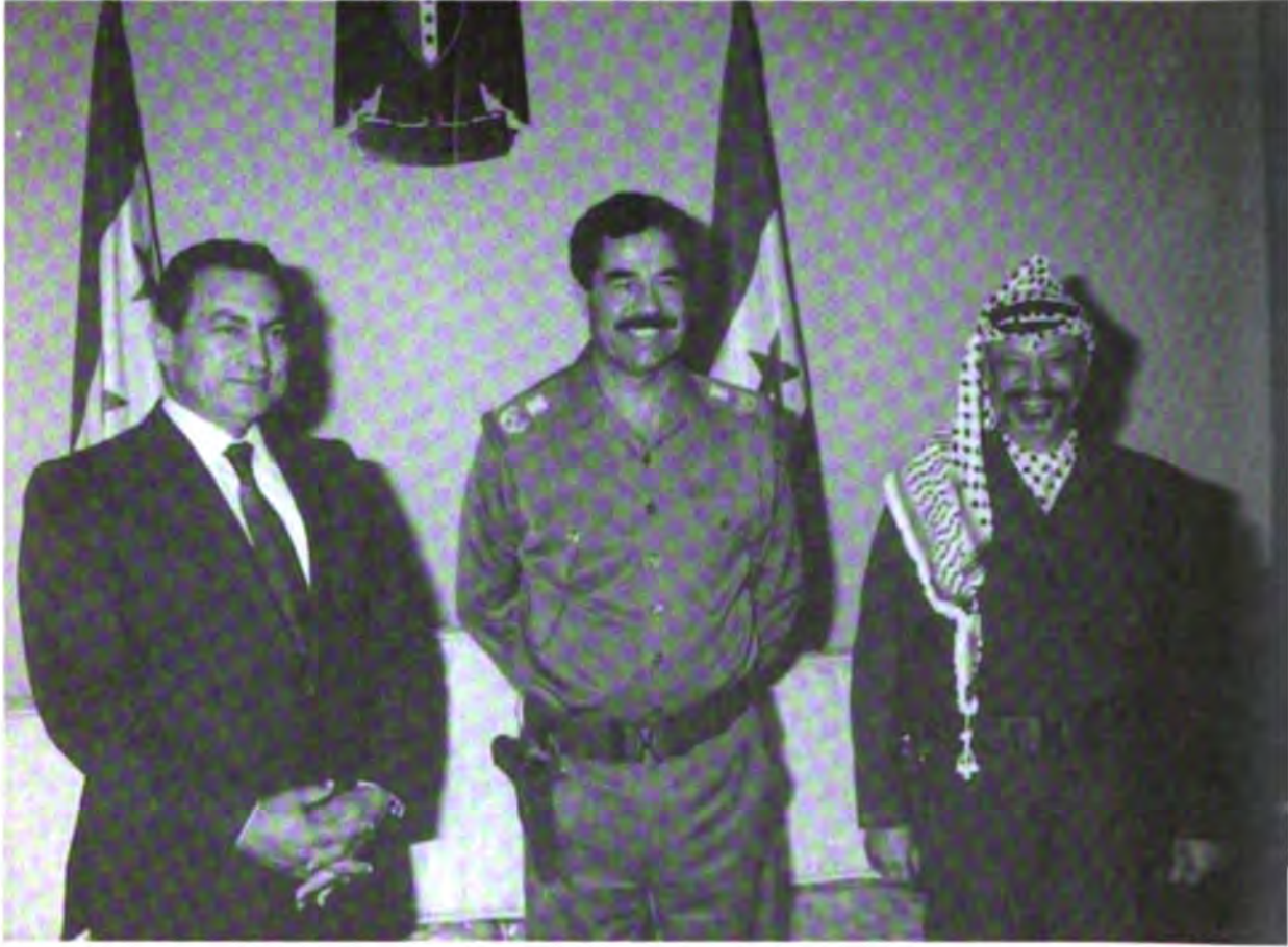
مع الرئيس العراقي صدام حسين والرئيس المصري حسني مبارك